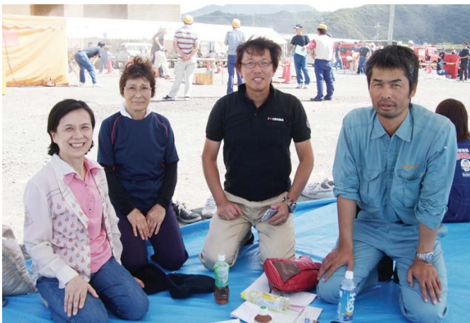
今回参加された皆さん

成績はフルいりませんが、通報の仕方と初期消火の技術を経験することができ、いざという時に役立てると確信いたしました。