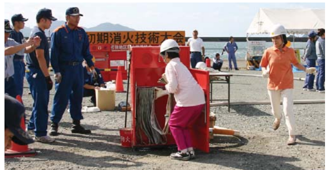
屋内消火栓の部の様子

小浜での初期消火大会は若狭地区市町の事業所、20団体（111名）の参加があり、まず入場行進、選手宣誓、競技の説明が行なわれてから競技が始まりました。