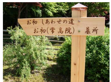
遊歩道入り口の看板

遊歩道の利用時間は、夏季（5月～10月）は7時～18時、冬季（11月～4月）は8時～17時です。小浜のパワースポットをみなさんも是非訪れてみて下さい。