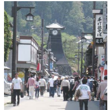
賑わいをみせる辰鼓楼周辺 土産店やそば屋が並ぶ

小浜西組にも、古き良き建物が残ってます。私は、古い木造の建物や格子戸が並ぶ情緒ある小浜の町並みが大好きです。それらを残し、今の生活にあった町づくりが進むことを望みます。まだまだこれから先時間はかかるでしょうが、熊川宿に継ぐ観光名所として、活気を取り戻せたらなあと思います。