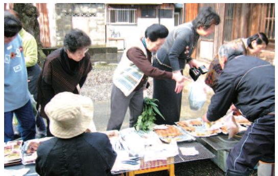
新鮮な野菜や干物が並び賑わう朝市