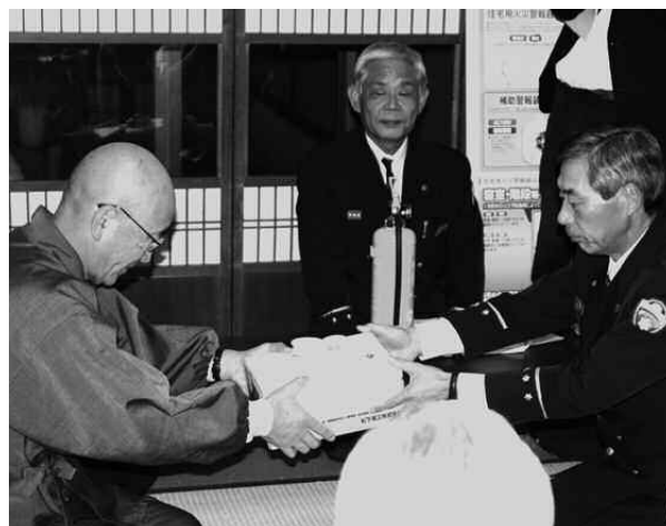
消火器と火災報知機を受取る