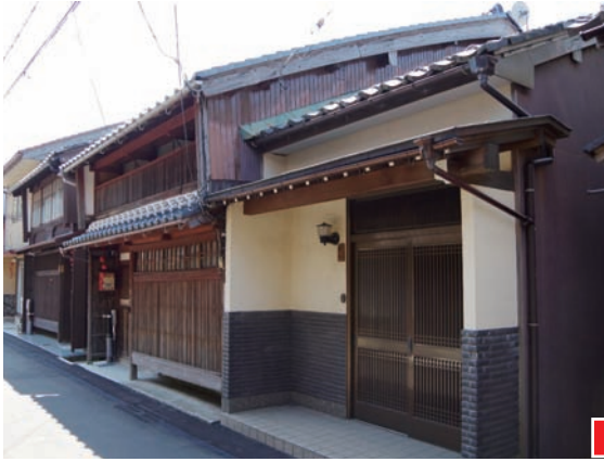
改修工事前の外観