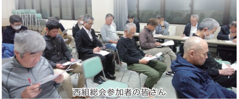
西組総会参加者の皆さん