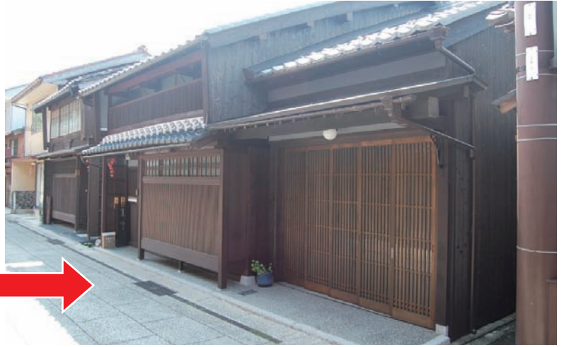
改修工事後の外観