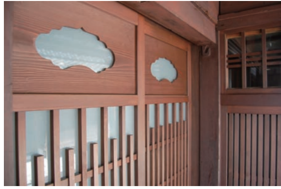
改修に合わせて復活した玄関戸の飾り窓

方としっかり相談・確認しながら改装すると良いと思います。工事が始まって、途中で気になることや変更したいことも、できるかどうかまずは、早めにプロの方に聞くことが大切だと思います。