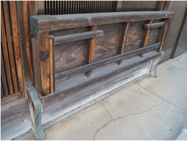
小浜住吉のがったり