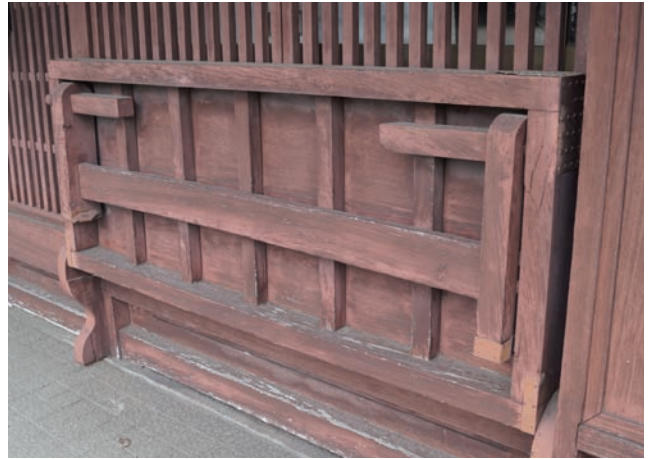
奈良 おふさ観音近くのがたり

みなさんも町並み通信に投稿してみませんか？ 町並み保存資料館までお寄せください。