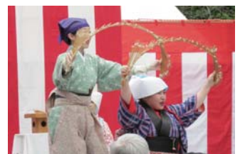
おさだ塾「南京玉すだれ」