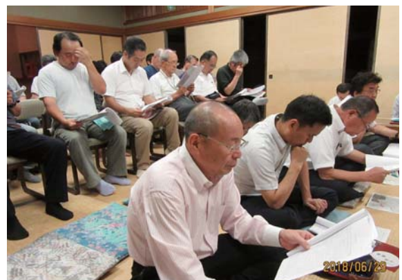
総会に出席の皆さん