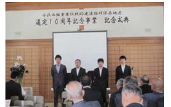
マスタープラン発表の4人