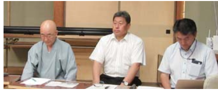
松崎市長（左）と 西組役員（右）

出席者数の確認：出席者44名 委任状14名 計（定足数38名を超えているため総会成立）