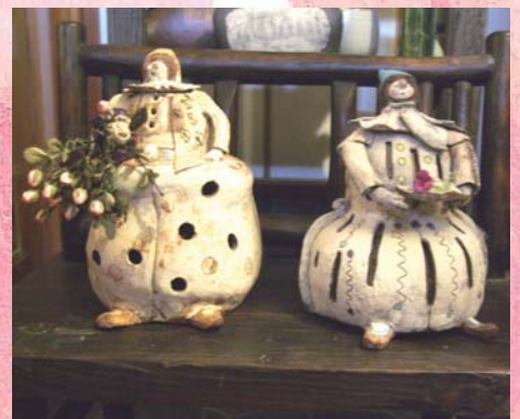
西洋風な人形たち