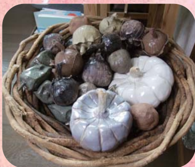
ころころ野菜はともリアし!