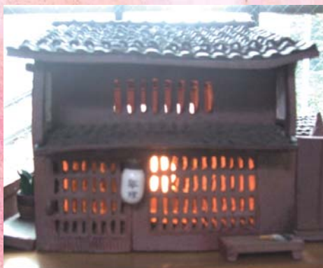
町家 (献燈やべんがら格子も再現)