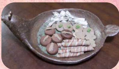
おやつまで焼き物に変身