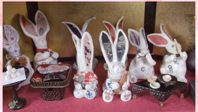
ウサギをモチーフにしたランブヤ置物